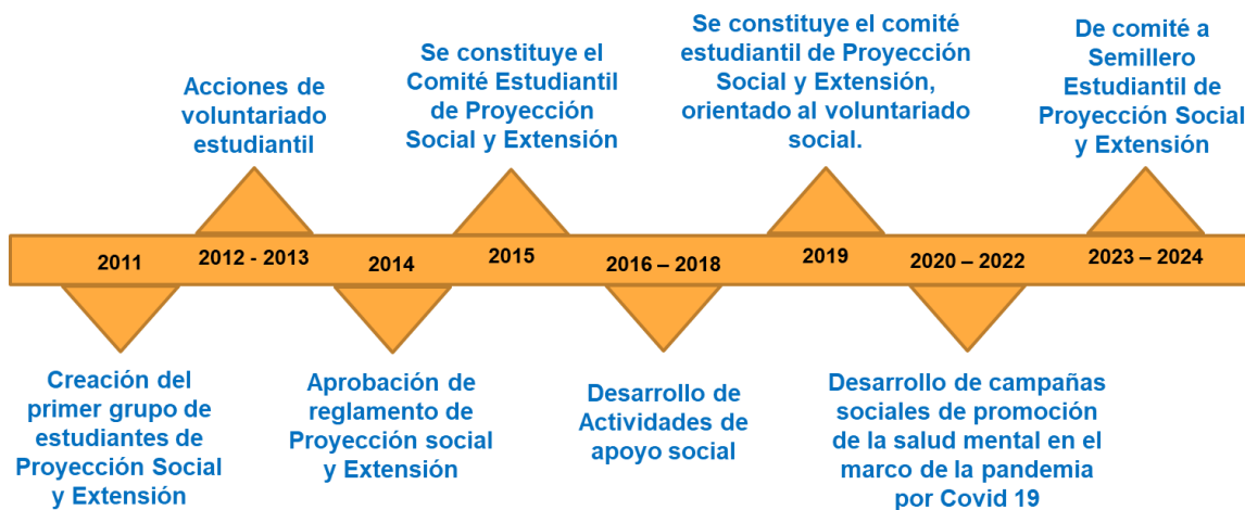
Figura 1: Línea del tiempo de la consolidación del Semillero Estudiantil de Proyección Social y Extensión.